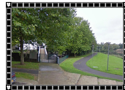
Salle Denis Diderot